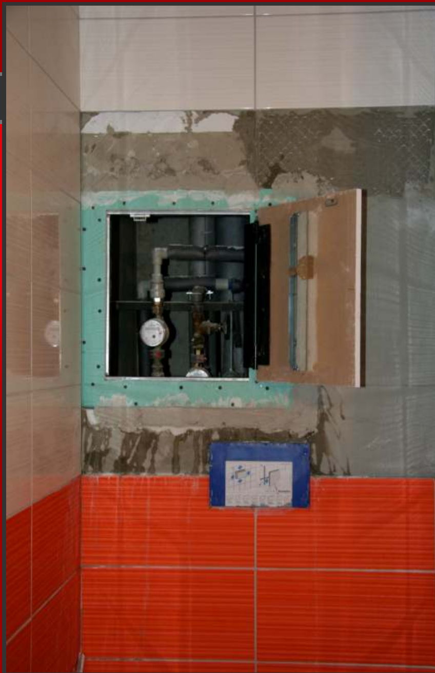
Osazení vlastního dvířka s pantem