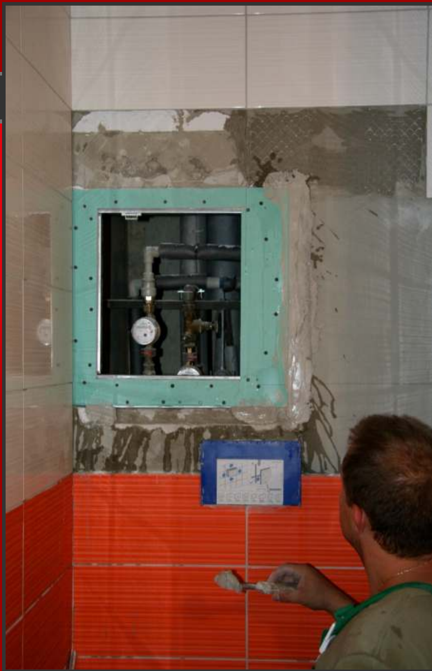
Osazení dvířka s rámečkem a jejich fixace