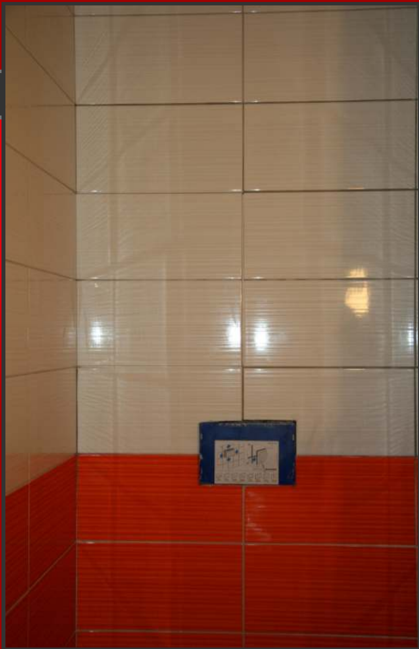
Pohled na zavřená dvířka a celou stěnu.