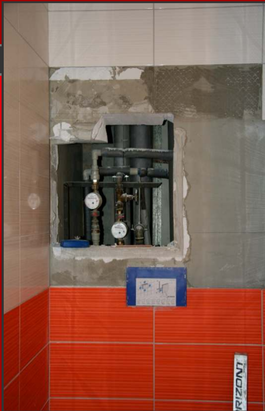
Pohled na připravený otvor