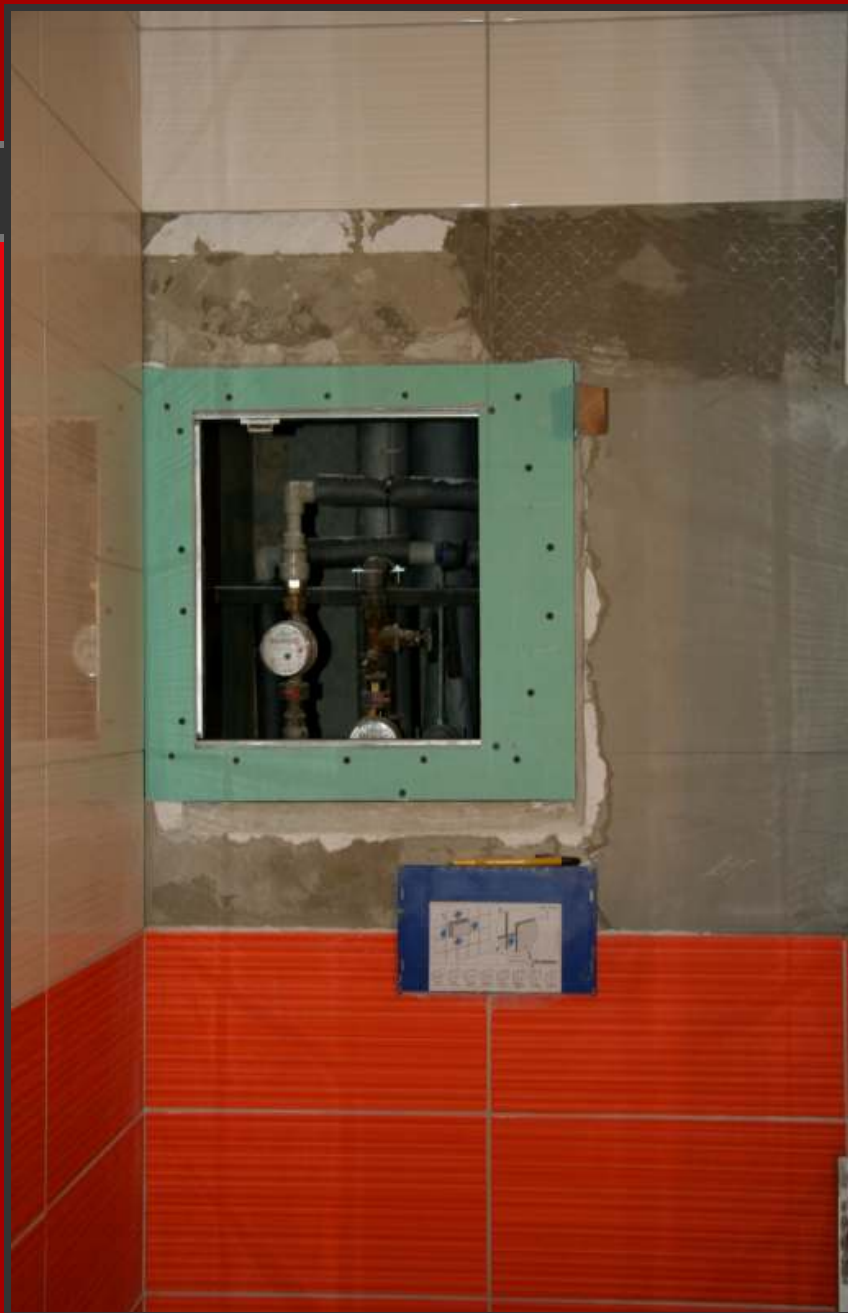
Osazení dvířka s rámečkem a jejich fixace